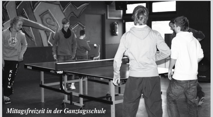
Mittagsfreizeit in der Ganztagschule

Auch wenn schon der Abgabeschluss war, kannst du dich weiterhin noch nachmelden, aber einige Kurse sind natürlich schon voll. Wir finden trotzdem bestimmt noch etwas Passendes für dich!