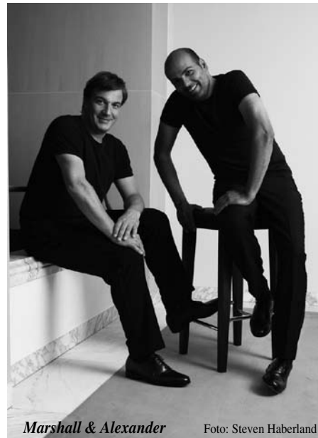
Marshall & Alexander

Aus Sicherheitsgründen werden die Kläranlagen vom Unternehmen geöffnet und ordnungsgemäß wieder verschlossen. Nach Beendigung der Entsorgung wird eine Benachrichtigung hinterlegt. Amt Oeversee -Steueramt -