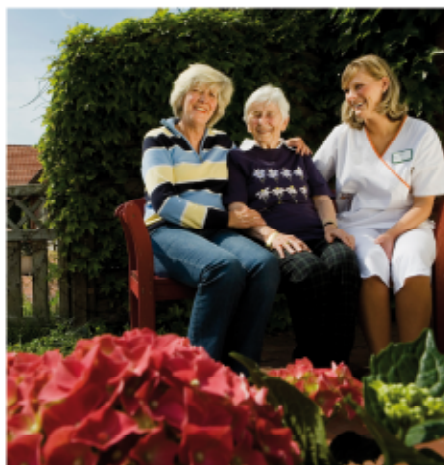
Kurzzeitpflege bei der CURA in Tarp möglich

Auch in Übergangssituationen, etwa nach einer stationären Behandlung im Krankenhaus, zahlt die Pflegekasse einen Aufenthalt von bis zu vier Wochen. Im CURA Pflegezentrum Tarp erhalten die Patienten eine optimale Nachsorge, bis sie gestärkt wieder nach Hause ziehen können.