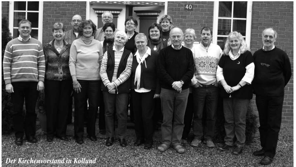
Der Kirchenvorstand in Kollund