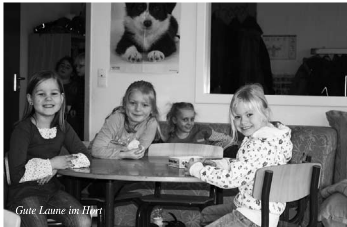
Gute Laune im Hort

In einer gemütlichen Runde stimmen wir uns ab 7.00 Uhr in der Frühbetreuungsgruppe der OGS in Ruhe auf den Tag ein, erzählen, spielen, malen, lachen. Dann gehen die Kinder zum Unterricht und die Betreuungsgruppe der OGS schließt ihre Pforten bis 11.20 Uhr. Nach der Schule besuchen momentan 32 Kinder unsere Einrichtung. Bei uns steht das soziale Lernen im Vordergrund, d.h. der höfliche