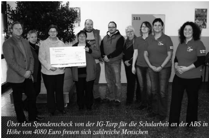
Über den Spendenscheck von der IG-Tarp für die Schularbeit an der ABS in Höhe von 4080 Euro freuen sich zahlreiche Menschen