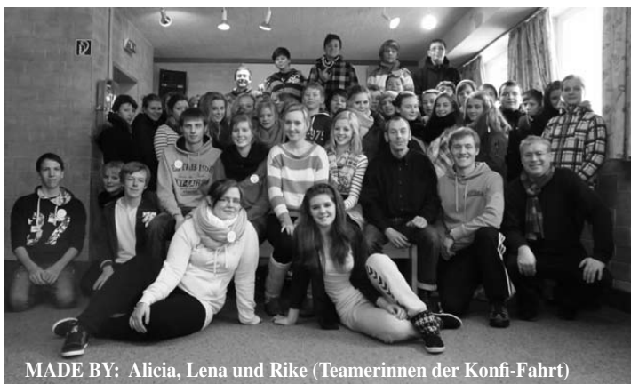
MADE BY: Alicia, Lena und Rike (Teamerinnen der Konfi-Fahrt)

Nähere Informationen unter www.kirchenmusik-tarp.de und unter 04638-441