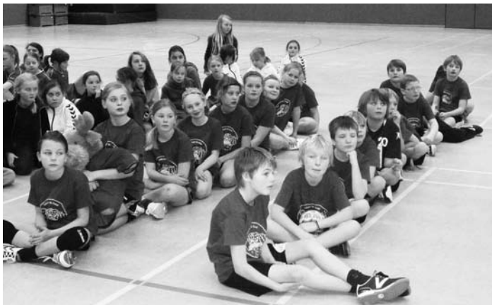
Die Grundschul-Mannschaften haben sich auf dem Spielfeld gesammelt: rechts die Jungen, links daneben die Mädchen der Schule im Autil

Nach hart umkämpften und fairen Spielen haben