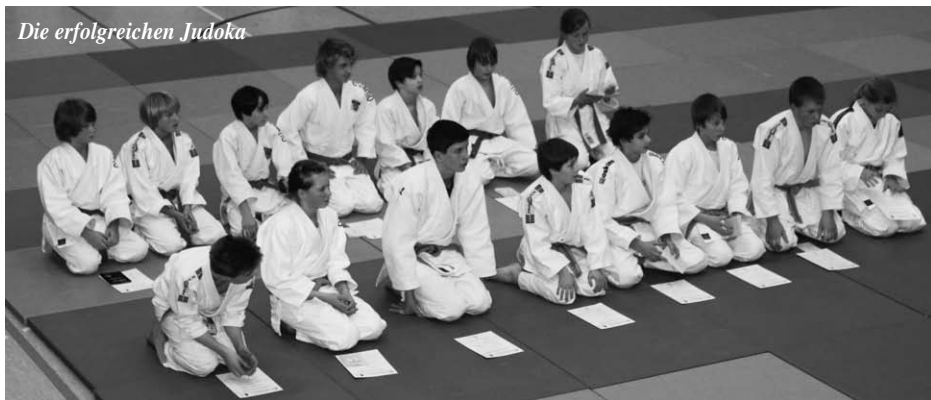
Die erfolgreichen Judoka

Immer Mittwoch treffen sich die Mitglieder zum Ganzkörper Workout und lassen sich in der Gym-