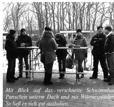
Mit Blick auf das -verschneite Schwimmbad Punschen unterm Dach und mit Wärmespender: So lieB es sich gut aushalten.

Abwechselnd treffen wir uns mit der DRK-Seniorentanzgruppe Neuberend. Die Begegnungen in der Gruppe und mit anderen Gruppen bringen Bewegung in den Alltag. Man kann sagen: Tanzen und Singen hält nicht nur fit, sondern ist auch „Gymnastik für die Seele“. (ar)